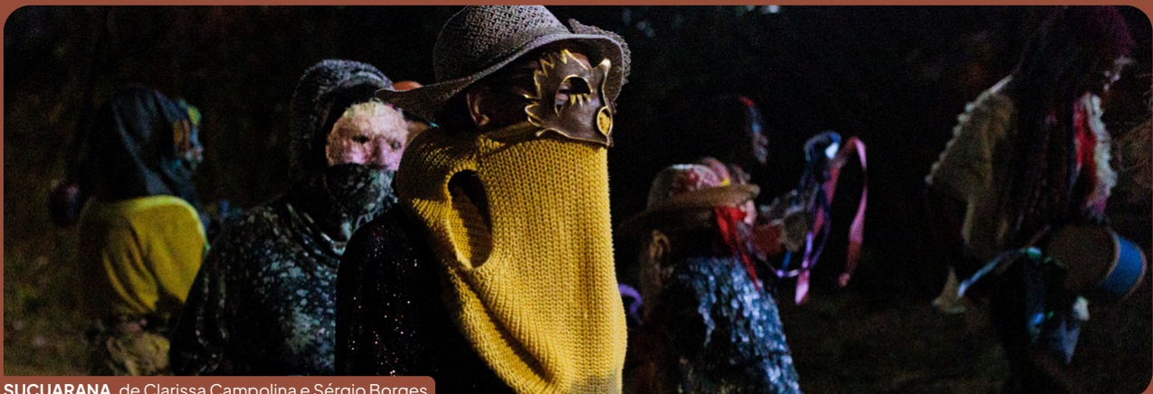
SUÇUARANA , de Clarissa Campolina e Sérgio Borges