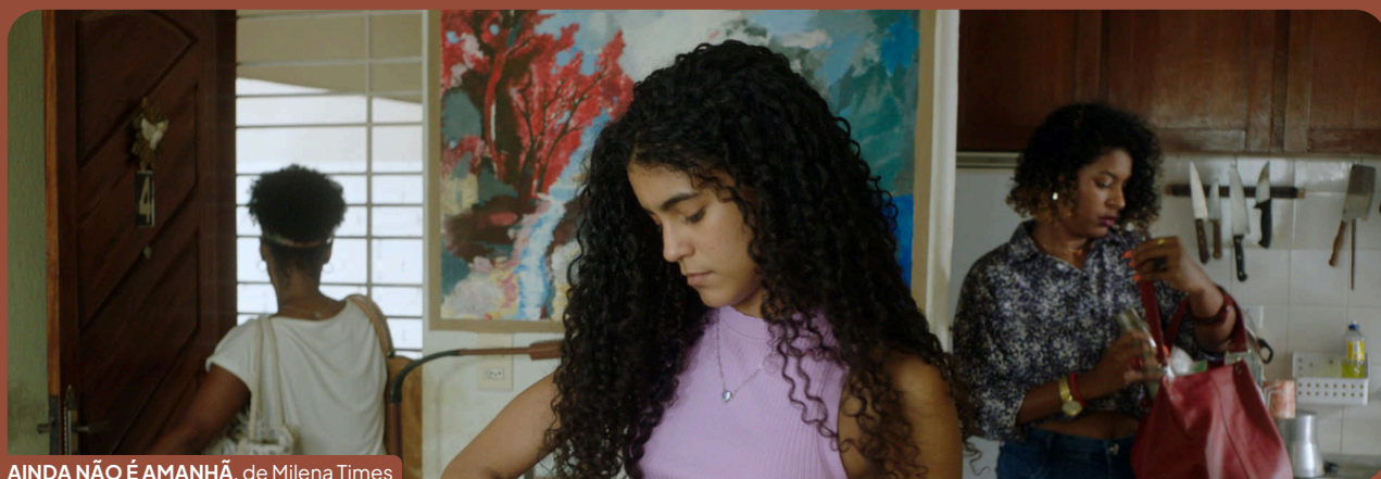
AINDA NÃO É AMANHÃ, de Milena Times