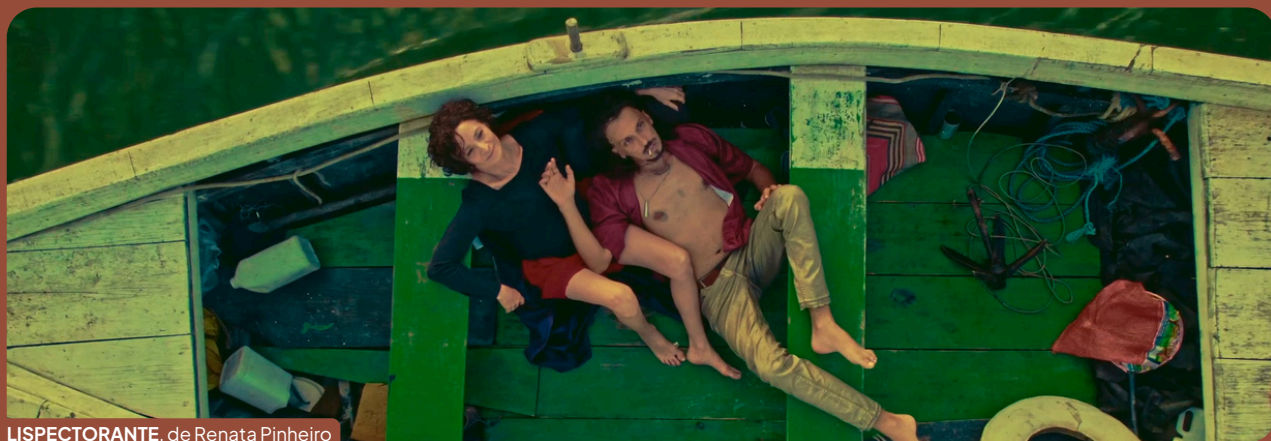
LISPECTORANTE, de Renata Pinheiro

Além disso, o Circuito Embaúba também reunirá diversas salas de cinema espalhadas pelo país, para a realização de sessões especiais integrando a cine-semana de programação do cinema, sem a necessidade de que o filme esteja programado durante todo o período.