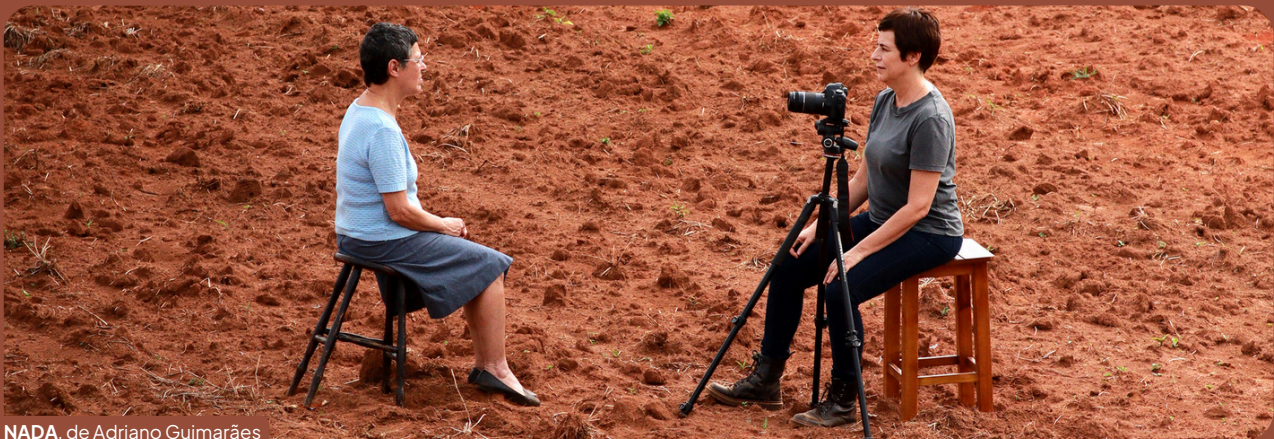
NADA , de Adriano Guimarães

Nosso objetivo maior é expandir o acesso aos filmes que lançamos, alcançando novos espaços que compartilhem do nosso compromisso com a pluralidade do cinema brasileiro.